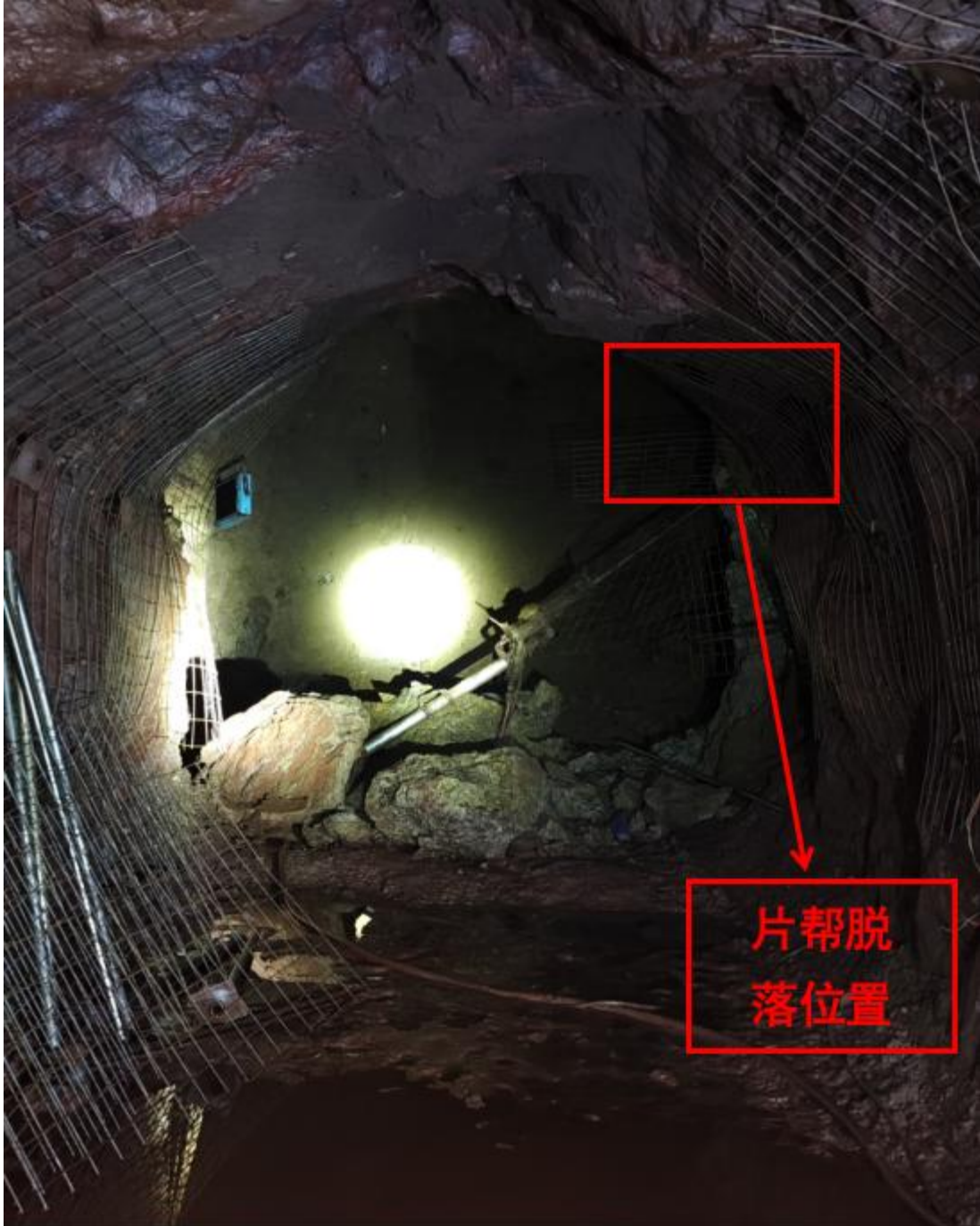
图 1 事故现场图